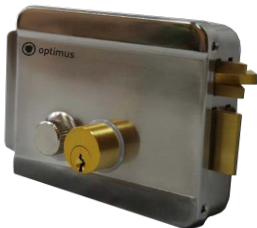
Optimus EMR-02 (хром)