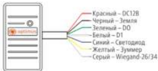
Рисунок 1. Цветовая маркировка проводов

*Чтобы переключить выходной интерфейс считывателя OPTIMUS CR-01, необходимо замкнуть серый контакт «Wiegand-26/34» с черным «Земля».