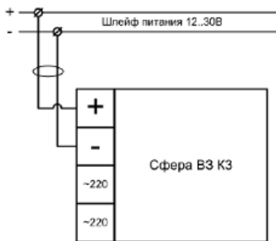
Схема подключения оповещателя Сфера В3 Компл.3; питание постоянным током.