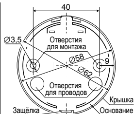
Рис.3 Задняя стенка.

Величина оконечного резистора R ок определяется в соответствии с техническим описанием ППКП