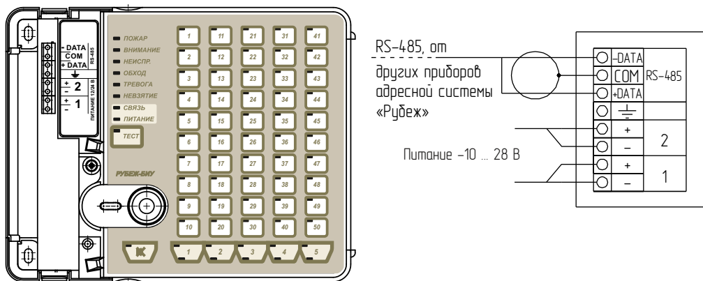
Рисунок 1 - Внешний вид и способ подключения прибора